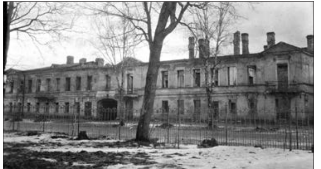
Освобождение Гатчины, проспект 25 Октября, 9, январь 1944. Источник: Андрей Бураков