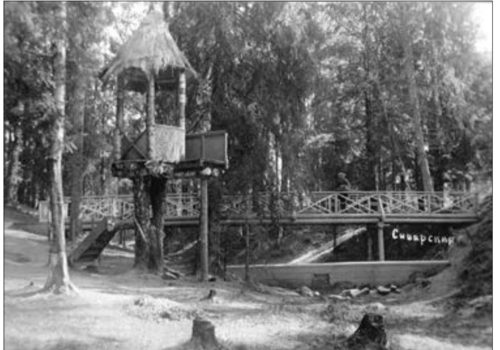
Беседка на территории дома отдыха. Фотография 1939 года

Некоторое время фотограф не мог найти себе ра-