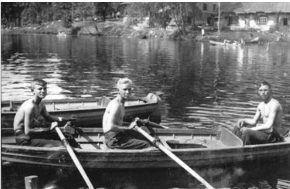
Сиверская. Мальчишки на лодочной станции. Фотография 1939 года