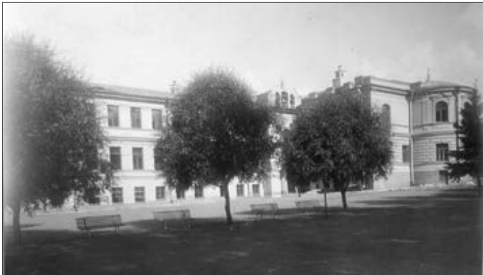
Гатчинское реальное училище имени Императора Александра III. 1911 год