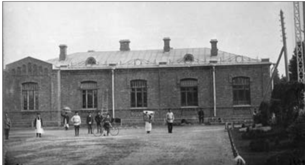
Станция Гатчина-Варшавская. Здание приёмного покая. 1911 год