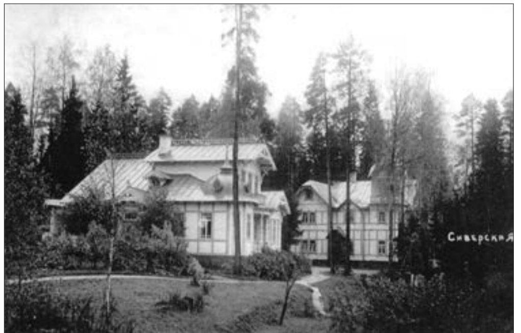
Дачи дома отдыха со стороны реки Ордеж. Довоенная фотография