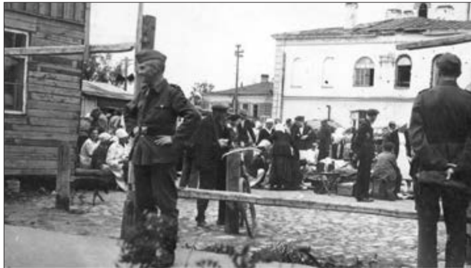
Чёрный рынок на улице Красной. Лето 1942 года.